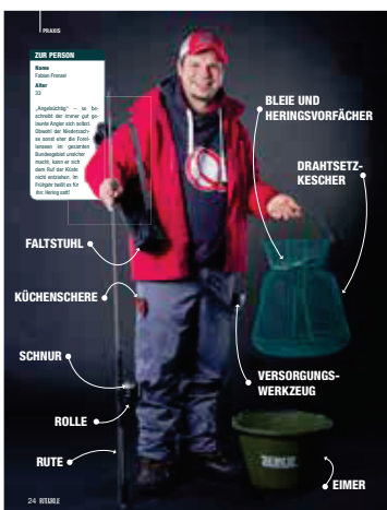
24 Immer dabei: gut gerüstet in die Heringszeit