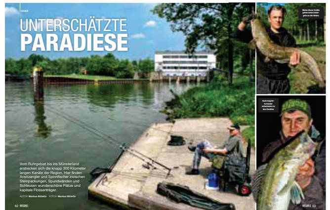
62 Künstliche Wasserstraßen durchziehen das Land und bieten Potenzial für fischreiche Stunden