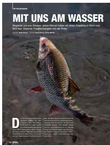
36 Sean Perez startet die Saison am Fluss